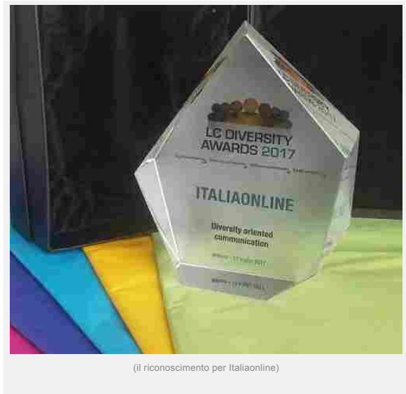
(il riconoscimento per Italiaonline)

Sono stati assegnati il 13 luglio presso lo Spazio Scalarini, a Milano, i premi della prima edizione dei Legal Community Diversity Awards, il riconoscimento attribuito ad aziende e istituzioni impegnate nella valorizzazione della diversità e nella garanzia dei diritti, con il patrocinio del Comune di Milano. L'evento di premiazione è stato organizzato da legalcommunity.it in collaborazione con Dentons, Gattai Minoli Agostinelli & Partners, Sea e con il supporto di Edelman Italia, 30% Club, Asla Women, Parks, Pwn Milan, The British Chamber of Commerce for Italy e Valore D. Tra le società premiate, anche Italiaonline, risultata vincitrice nella categoria Diversity Oriented Communication. "L'azienda è impegnata nel rispetto della diversità a 360", si legge nella motivazione che cita come esempio "le attività di comunicazione, sia interna che esterna, fortemente 'women oriented', tra le quali "la campagna di recruiting JobRapido e la campagna 'stop alla violenza sulle donne'. "L'azienda ha pianificato attività di comunicazione a sostegno delle vittime del cyberbullismo e campagna radio e web gayfriendly".