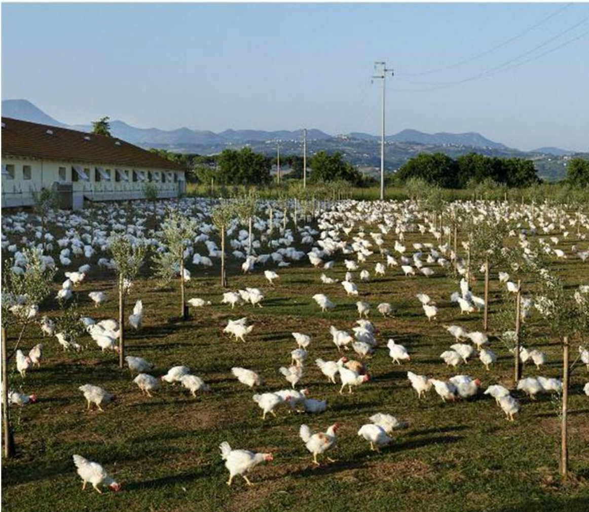
Uno dei 300 allevamenti che fanno parte del gruppo marchigiano che ha il suo core business nella filiera avicola biologica

La proprietà intellettuale è riconducibile alla fonte specificata in testa alla pagina. Il ritaglio stampa è da intendersi per uso privato